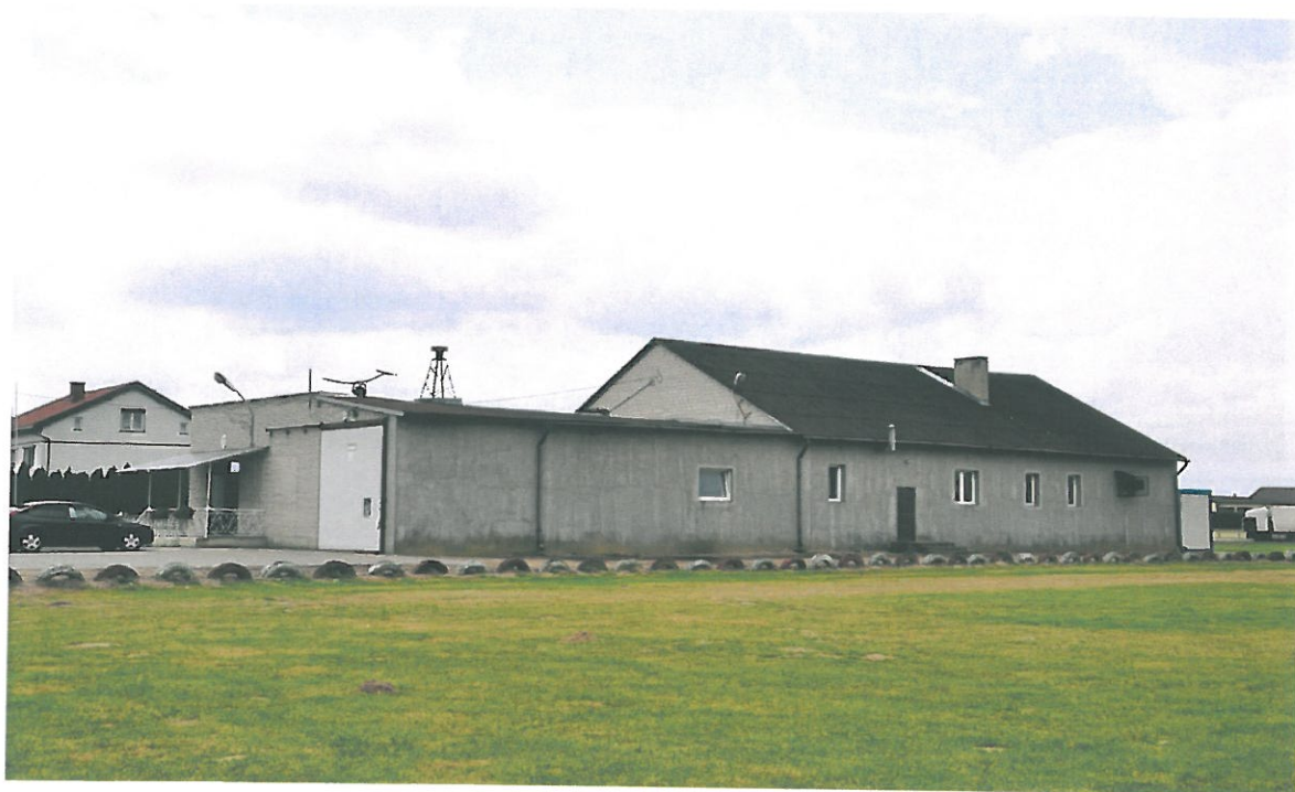
Fot. Remiza strażacka w Słomkowie Suchym

Remiza pełni rolę świetlicy wiejskiej, gdzie odbywają się wszystkie imprezy i zebrania wiejskie. Jest to miejsce, gdzie mieszkańcy wsi mogą podejmować nowe, ciekawe inicjatywy. Ich siła często polega na tym, że przyciąga lokalnych liderów – prężnie działających, aktywnych ludzi. Członkowie OSP uczestniczą w jej strukturach dobrowolnie i nie otrzymują z tego tytułu żadnego wynagrodzenia. Zyskują natomiast coś innego, nieprzeliczalnego na pieniądze – ich społeczna działalność budująca siłę lokalnej społeczności budzi szacunek i respekt mieszkańców – jest zatem powodem do dumy i satysfakcji.