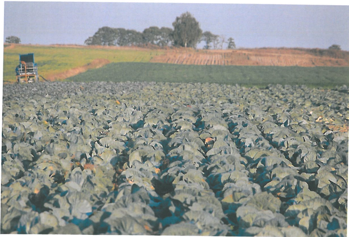
Fot. Pola uprawne.