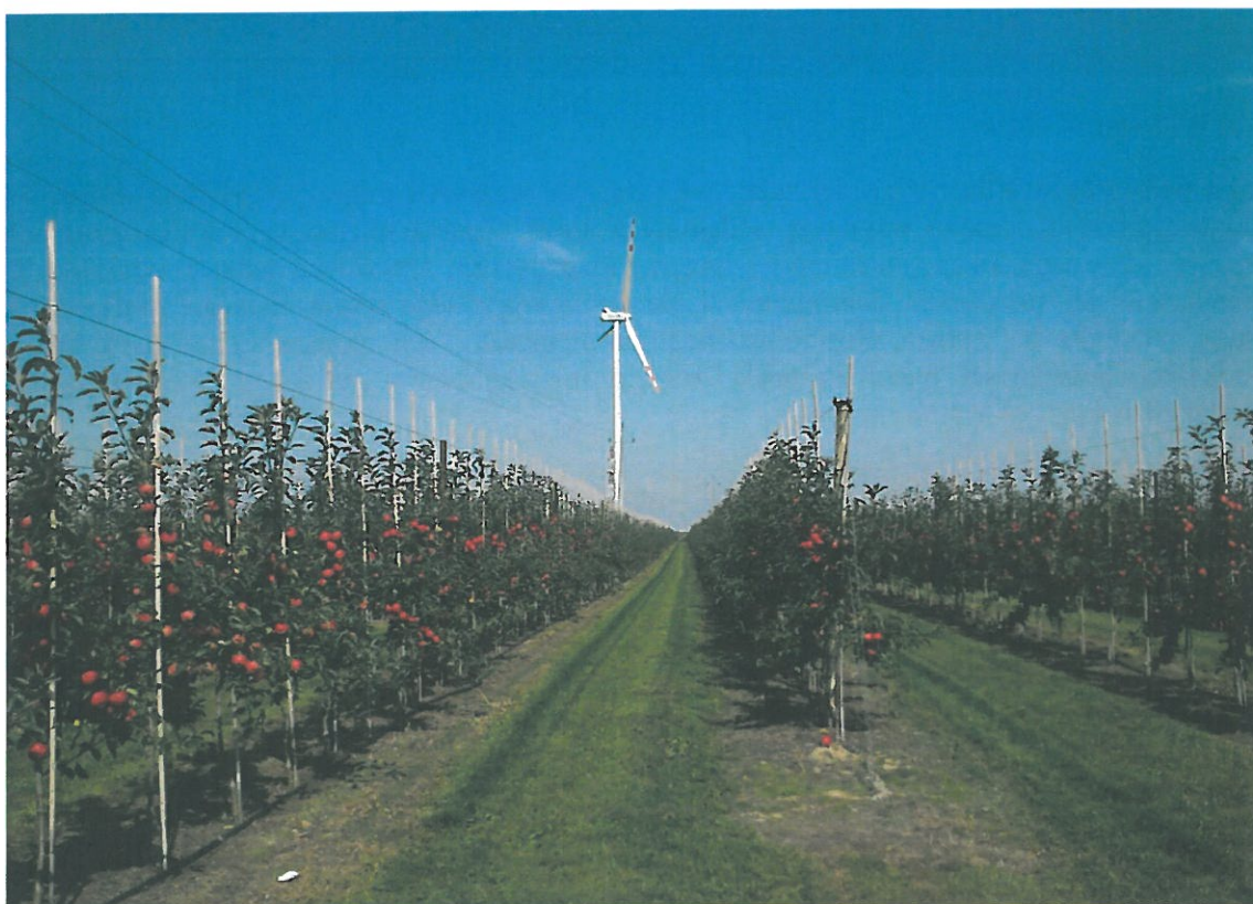
Fot. Sady jabłoniowe

Wyższa produkcja towarowa, rozwinięte przechowalnictwo, wysokie usprzętowanie gospodarstw i możliwości transportowe stanowią poważną ofertę dla przetwórstwa rolno-spożywczego i zaopatrzenia.