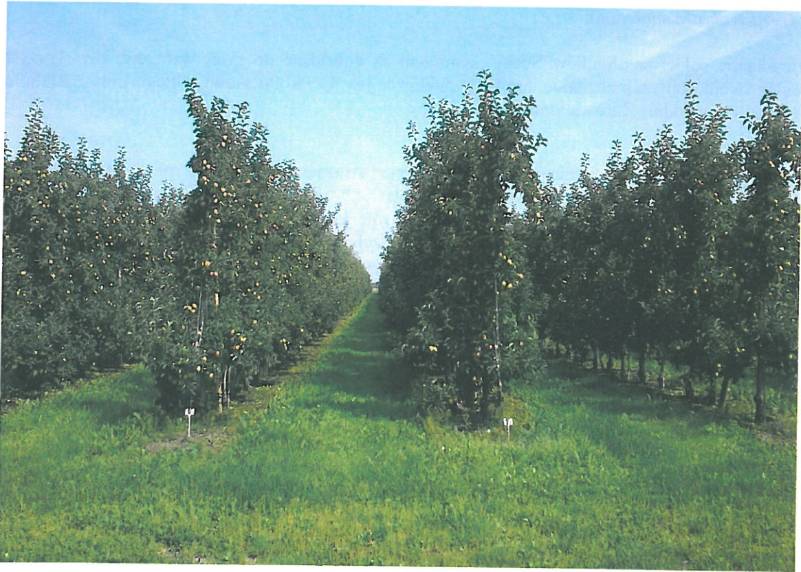
Fot. Sady jabłoniowe