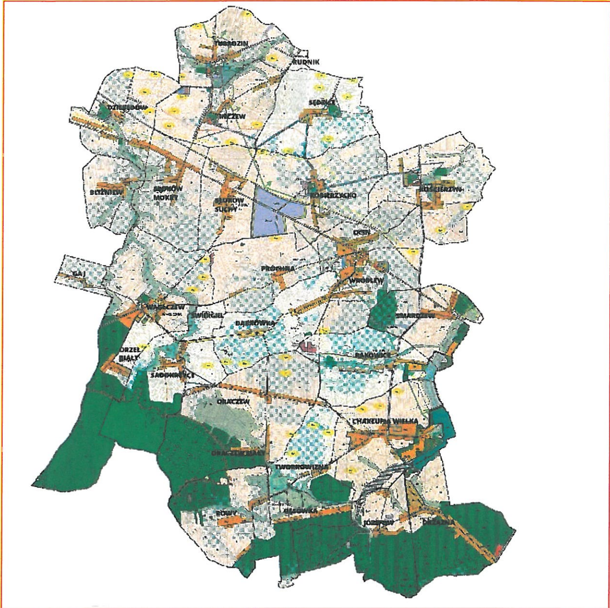
1. Lokalizacja sołectwa Wąglczew (wsie: Wąglczew, Orzeł Biały, Gaj, Wąglczew – Kolonia)

Opracowany Plan nie jest dokumentem zamkniętym. Na każdym etapie jego wdrażania wraz ze zmieniającymi się okolicznościami i wymaganiami będzie możliwość jego modyfikowania, uzupełniania i udoskonalania.