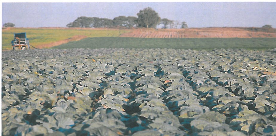
Fot. Pola uprawne.